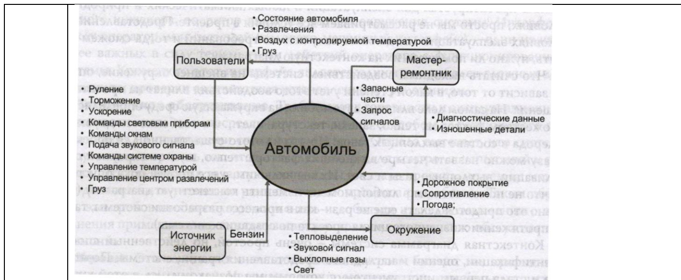
Рис. 1. Контекстная диаграмма для автомобиля