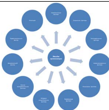
Рисунок 2. Внутренние факторы влияния на имидж организации

Внутренние факторы влияния – факторы, воздействие и влияние которых напрямую зависит от сотрудников и менеджмента организации, подвержены контролю и изменениям внутри организации.