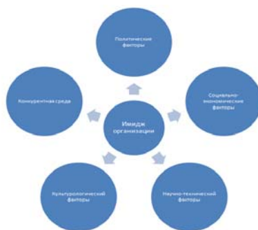
Рисунок 1. Внешние факторы влияния на имидж организации

субъектами (организациями) за потребителей и поставщиков, партнёров, лидирующего положения в отрасли.